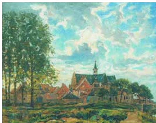
Hendrik v. Bloem

verrichtte hij zelf nog spoed-eisende medische ingrepen in het Gasthuis.